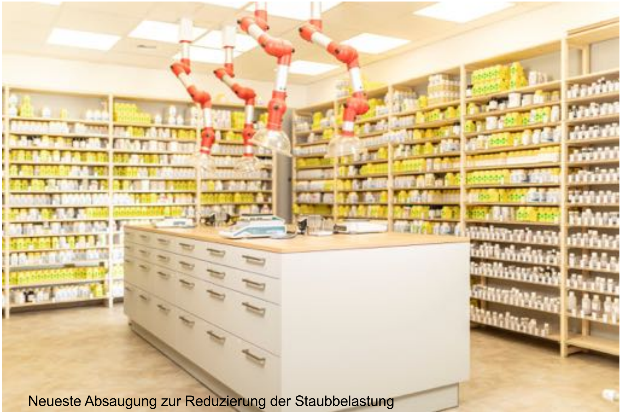
Neueste Absaugung zur Reduzierung der Staubbelastung