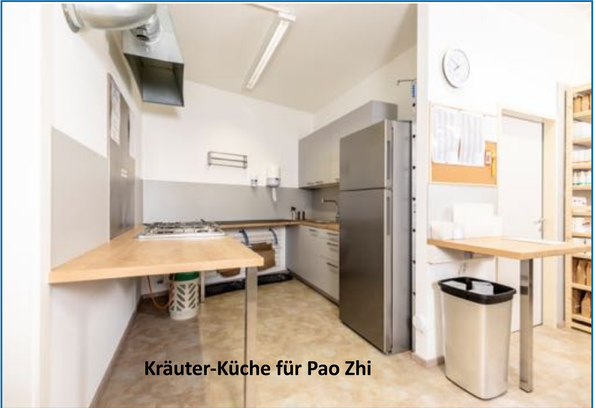
Kräuter-Küche für Pao Zhi