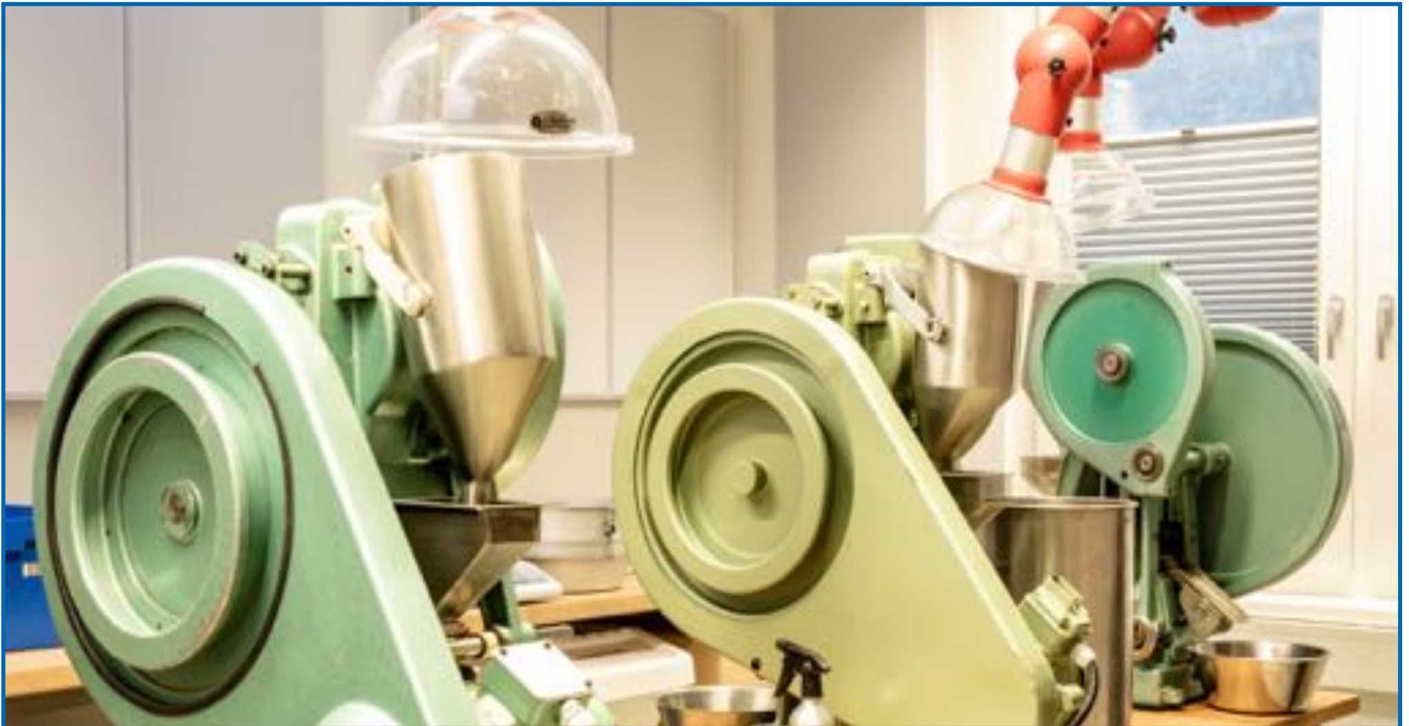
Pressraum mit Absaugvorrichtung